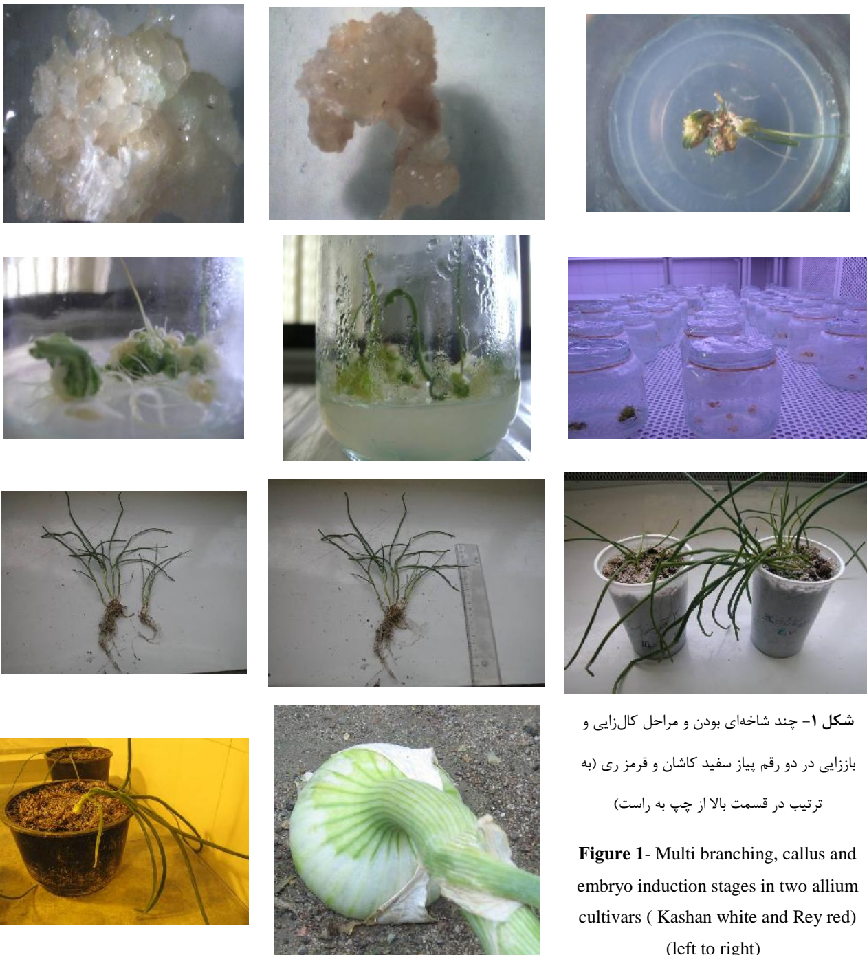
شکل ۱- چند شاخه‌ای بودن و مراحل کال‌زایی و باززایی در دو رقم پیاز سفید کاشان و قرمز ری (به ترتیب در قسمت بالا از چپ به راست)